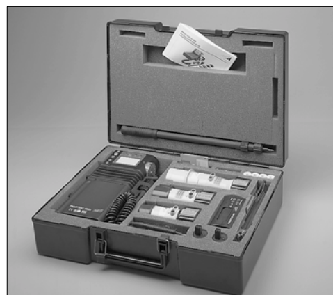
Bestückungsbeispiel Tragkoffer K100